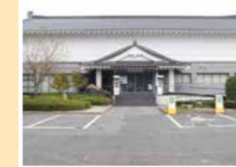
MAP 9 安芸高田市 安芸高田市歴史民俗博物館

宮島の歴史や文化に関する資料を 約1000点展示。美しい日本庭園を 囲むように建物が配置されている。 往広島県廿日市市宮島町57 ☎0829-44-2019 回なし 回宮島橋から徒歩20分