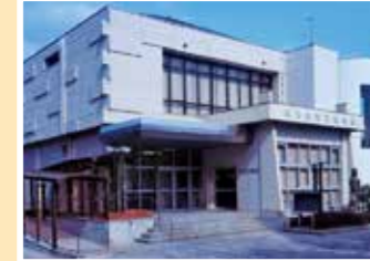
MAP 7 東広島市 東広島市立美術館

国の登録有形文化財。「白石灯台」 をはじめ、灯台や明かりの歴史につ いて知ることができる。 往広島県大竹市阿多田島田ノ浦449 ☎0827-53-5800(大竹市生涯学習課) 回小方港 20台 回小方港から阿多田港 までフェリーで35分、阿多田港から徒歩25分