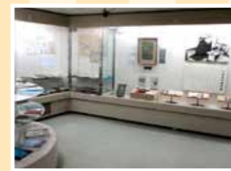
MAP 15 江田島市 大柿地区歴史資料館・灘尾記念文庫

常設展や筆づくりの実演から、筆の 歴史や文化が学べる。書筆づくりの 体験もできる(体験料3500円)。 往広島県安芸郡熊野町中満5-17-1 ☎082-855-3010 回84台 回山陽自動車道志和ICから車で35分