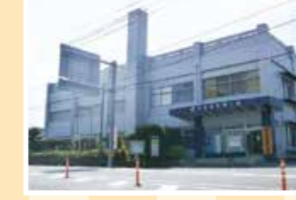
MAP 24 田布施町 田布施町郷土館

旅館だった「四階楼」に関する資料 のほか、瀬戸内海の海上交通の要 衝として栄えた町の歴史を紹介。 往山口県熊毛郡上関町大字津屋868-1 ☎0820-62-6040 回あり 回山陽自動 車道玖珂または熊毛ICから車で50分