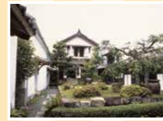
MAP 19 柳井市 商家博物館 むろやの園

旧岩国藩主吉川家により1945年に 建設された市立の博物館。江戸時 代の岩国に関する資料を展示する。 往山口県岩国市横山2-7-19 ☎0827-41-0452 回なし 回山陽自動車道岩国ICから車で10分