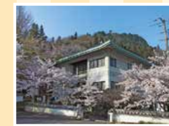
MAP 17 世羅町 大田庄歴史館

11/11(土)・12(日)・18(土)・19(日) に秋の一般公開を実施。紅葉で美 しく彩られる庭は必見だ。 往広島県山県郡安芸太田町加計 ☎0826-22-2525(太田川交流館かはし) 回太田川交流館かはし100台 回中国自動車道戸内ICから車で15分