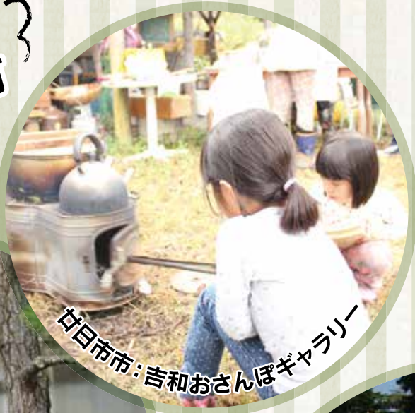
廿日市市: 吉和おさんぽギャラリー