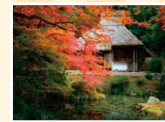
MAP 16 安芸太田町 吉水園

大柿地区の歴史を伝える史料館。 11/23(祝)～12/3(日)、生誕150年 を記念し六角紫水展を開催。 往広島県江田島市大柿町大原1068-6 ☎0823-57-6420 回5台 回早瀬大橋から車で10分