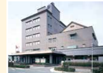
MAP 4 竹原市 たけはら美術館

「旧呉鎮守府司令官官舎」(国重要 文化財)などがあり、近代日本の 歴史を感じることができる。 往広島県呉市幸町4-6 ☎0823-21-1037 回入船山公園 122台 回JR呉駅から徒歩13分