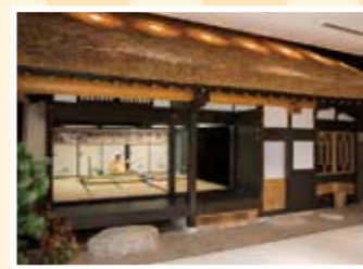
MAP 14 熊野町 筆の里工房

10/7(土)・8(日)、秋祭りを開催。獅 子舞などが奉納される。御座船が航 海する姿を表した曳船は必見。 往広島県安芸郡坂町坂東2-8-1 ☎082-885-1248 回秋祭り開催時は 役場横の臨時Pを利用 回JR坂駅から徒 歩10分