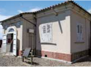
MAP 6 大竹市 阿多田島灯台資料館

戦国武将・小早川隆景が築いた三 原城を中心に、歴史や文化、観光地 を紹介する。 往広島県三原市城町1-2-1ベアシティ三 原西館1F ☎0848-62-0450 回なし 回JR三原駅南口から徒歩2分