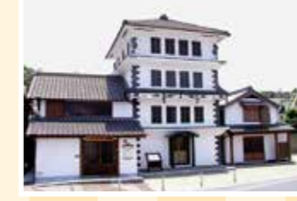
MAP 23 上関町 四階楼 上関町郷土史学習館

往山口県熊毛郡平生町佐賀3900-14 ☎0820-56-1100 回7台 回山陽自動車道玖珂または熊毛ICから車で40分