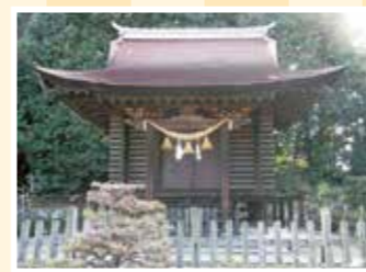
MAP 10 府中町 多家神社宝蔵

毛利氏の本拠地で西日本最大級を 誇る郡山城の歴史資料などを展 示。甲冑の試着コーナーも人気だ。 往広島県安芸高田市吉田町吉田278-1 ☎0826-42-0070 回20台 回広電バス 安芸高田市役所バス停から徒歩10分