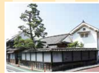
MAP 11 海田町 旧千葉家住宅

1874年の多家神社創建に際して移 築された広島城三の丸稲荷社の社 殿の一つ。県の重要文化財に指定。 往広島県安芸郡府中町宮の町3-1-13 ☎082-282-2427(多家神社) 回50台 回JR天神川駅から徒歩15分