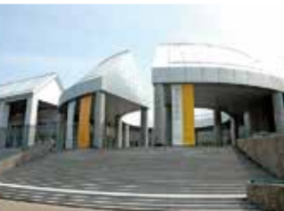
MAP 2 広島市 広島市現代美術館

史跡吉川氏城館跡全体を案内する 展示施設。発掘調査の成果や出土 品などを展示する。 往広島県山県郡北広島町海成寺255-1 ☎0826-83-1785 回28台 回中国自動車道千代田ICから車で20分