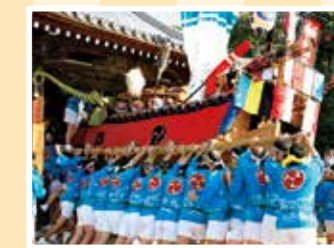
MAP 13 坂町 八幡山八幡神社

昭和初期の内務大臣・望月圭介の 生家。魅力のある島の文化と歴史が 体感できる。 往広島県豊田郡大崎上島町東野2721-1 ☎0846-67-3229 回20台 回竹原港から垂水港または白水港へ、各港 から車で5分