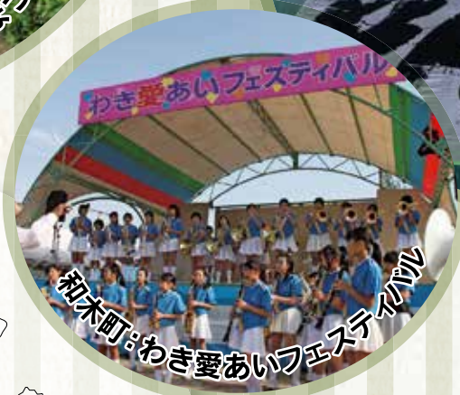
和木町: わき愛あいフェスティバル