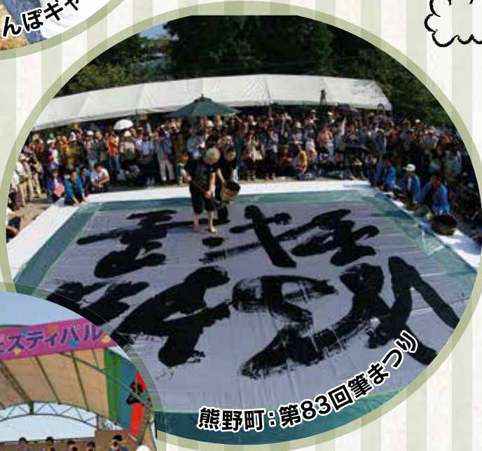
熊野町: 第83回筆まつり