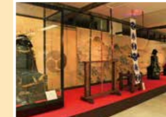
MAP 5 三原市 みはら歴史館

竹原市出身の元内閣総理大臣・池 田勇人氏が収集した美術品ほか同 市ゆかりの作家の作品を所蔵。 往広島県竹原市中央5-6-28 ☎0846-22-3558 回60台 回JR竹原駅から徒歩5分