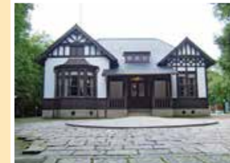
MAP 3 呉市 入船山記念館

比治山にある美術館。企画展のほか、 1500点以上の所蔵作品を紹介する コレクション展などを開催する。 往広島県広島市南区比治山公園1-1 ☎082-264-1121 回比治山公園第二駐車場を利用 回広島電鉄比治山下電停から徒歩7分