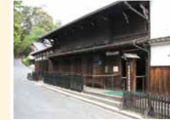
MAP 8 廿日市市 宮島歴史民俗資料館

市立では県内で最も歴史がある美術 館。日本の近現代版画、現代陶芸 などを所蔵し、展覧会も開催。 往広島県東広島市八本松南2-1-3 ☎0823-428-5713 回あり 回JR八本松駅から徒歩10分