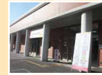
MAP 21 和木町 和木美術館 (アートウイング)

周防大島出身で、「三百六十五歩の マーチ」などの歌詞を手掛けた星野 哲郎の作品や資料などを展示する。 往山口県周防大島町大字平野 417-11 ☎0820-78-0365 回50台 回山陽自動車道玖珂ICから車で50分