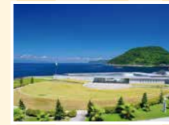
MAP 20 周防大島町 星野哲郎記念館

もとは油商の屋敷で、屋敷面積は国 内に現存する町屋の中でも最大級 を誇る。生活用具・文書などを展示。 往山口県柳井市柳井津屋439 ☎0820-22-0016 回14台 回山陽自動車道玖珂ICから車で20分