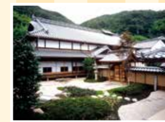
MAP 12 大崎上島町 海と島の歴史資料館

江戸時代、海田宿の要職を務めた 千葉家の旧宅。第二土曜の前日か ら4日間、10～16時の公開。 往広島県安芸郡海田町中店8-31 ☎0846-67-3229 回40台 回JR海田市駅北口から徒歩5分