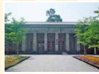
MAP 18 岩国市 岩国徴古館

世羅町で最も注目すべき歴史の一 つ「大田庄」の繁栄を文化財などを 通して紹介する資料館。 往広島県世羅郡世羅町甲山159 ☎0847-22-4646 回30台 回尾道松江自動車道世羅ICから車で5分