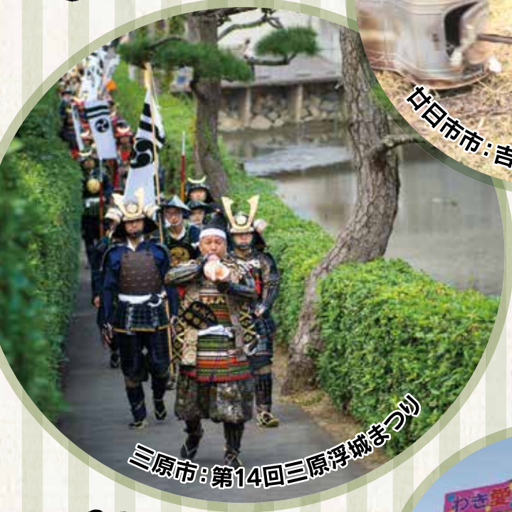
三原市: 第14回三原浮城まつり